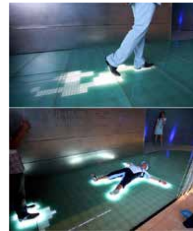
Illustrasjonsbilder utforming og materialbruk