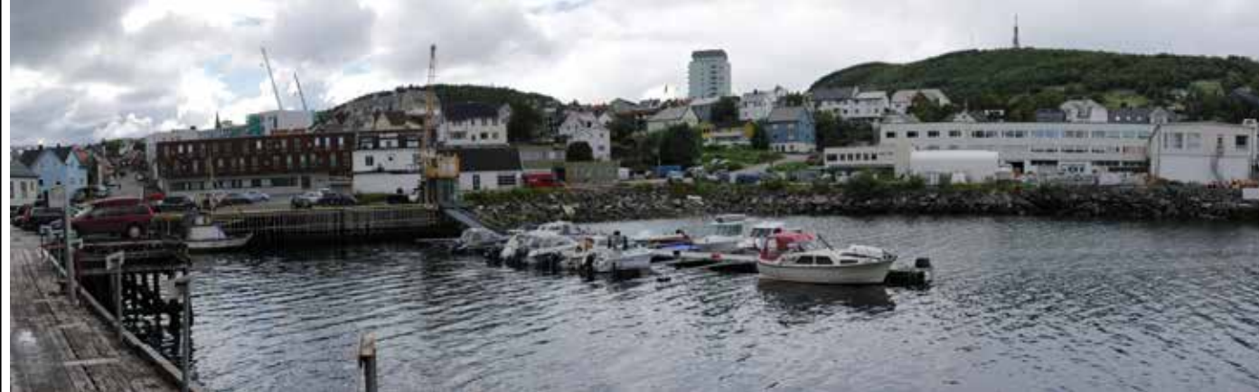
Eksisterende situasjon