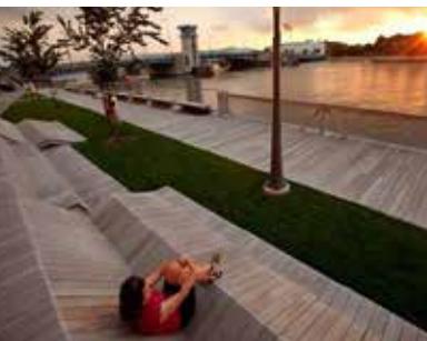
Illustrasjonsbilder utforming og materialbruk, kilde Pinterest.com