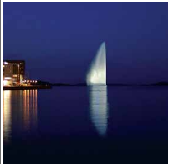
Selsbanes Seil, foto: Geir Samuelsen