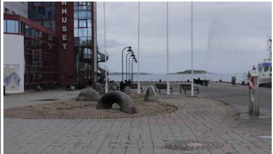
Eksisterende situasjon