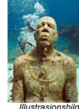
Illustrasjonsbilder.