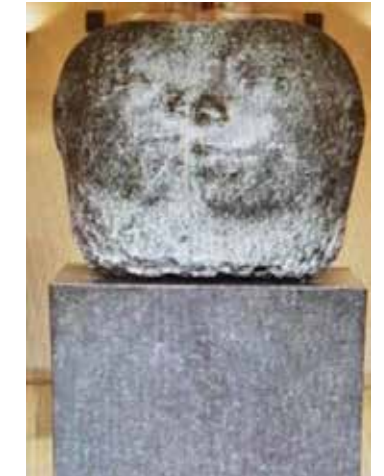
'Unity' av K.W.Goksøy