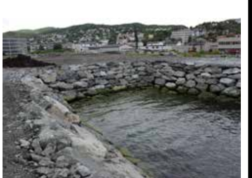
Eksisterende situasjon