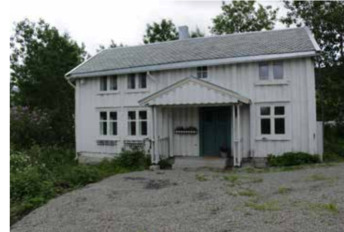
Eksisterende situasjon