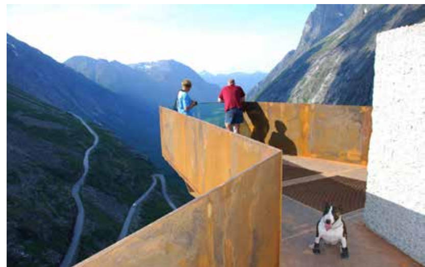
Trollstigen Visitor Centre, arkitekt Reiulf Ramstad