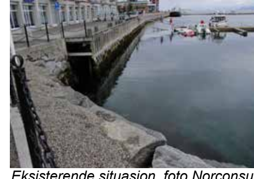
Eksisterende situasjon