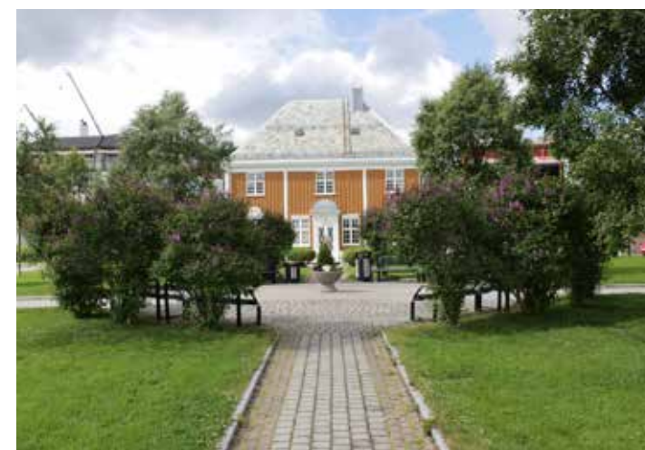
Eksisterende situasjon