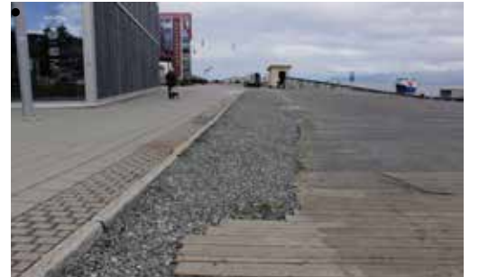
Eksisterende situasjon