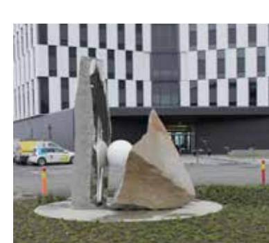
'Lys over land'