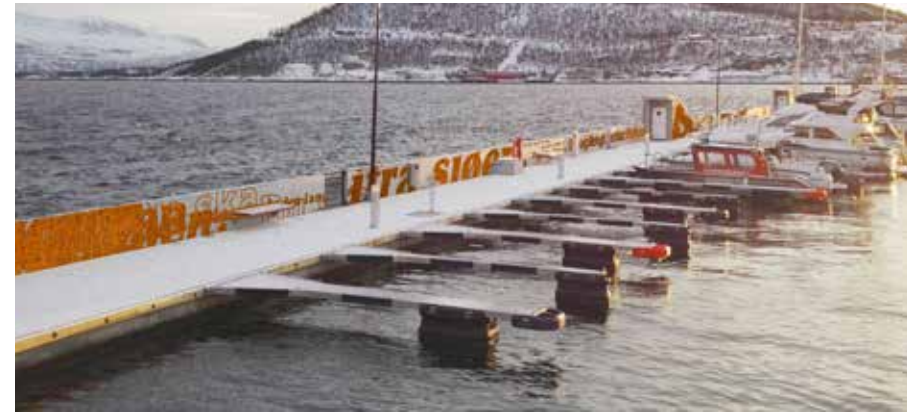
Bildemanipulasjoner og fotos Rampestrek